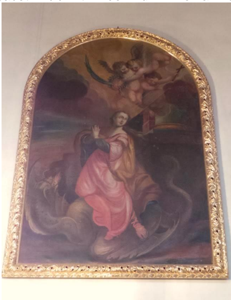
Bild der Hl. Margareta in der Pfarrkirche St. Margareta, Hofdorf